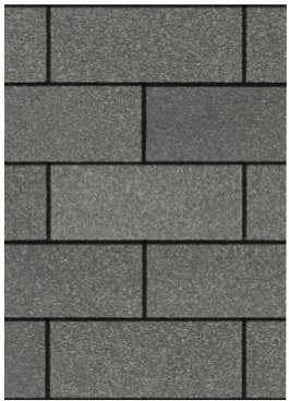
Estate Gray 1