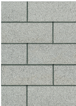
Shasta White 1