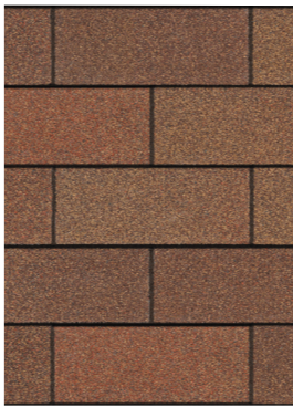
Autumn Brown 1

CONSULTE LA TABLA Y EL MAPA PARA CONOCER LA DISPONIBILIDAD DE COLORES