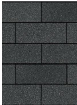
Onyx Black 1