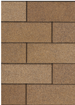
Desert Tan 1